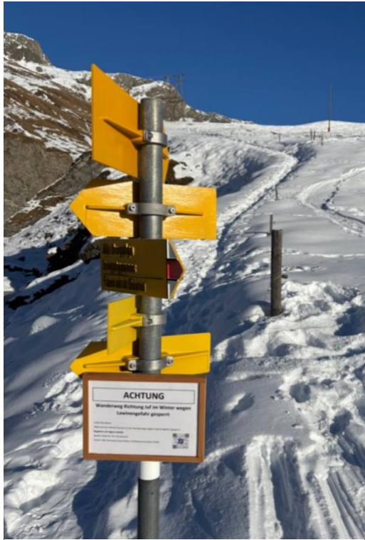
1 Im Winter muss der Weg von Juppa nach Juf entlang des Wengahorns aus Sicherheitsgründen gesperrt werden

Das Jahr 2025 war ein eher ruhiges Jahr für den Verein «aASt». Wir wurden verschont vor grösseren Schäden an der Weginfrastruktur durch Naturereignisse, haben stabile Verhältnisse in den Finanzen und der Anzahl Vereinsmitglieder und eine «Baustelle» zur Herrichtung eines beschädigten Wegstückes. Doch nun noch etwas genauer und der Reihe nach.