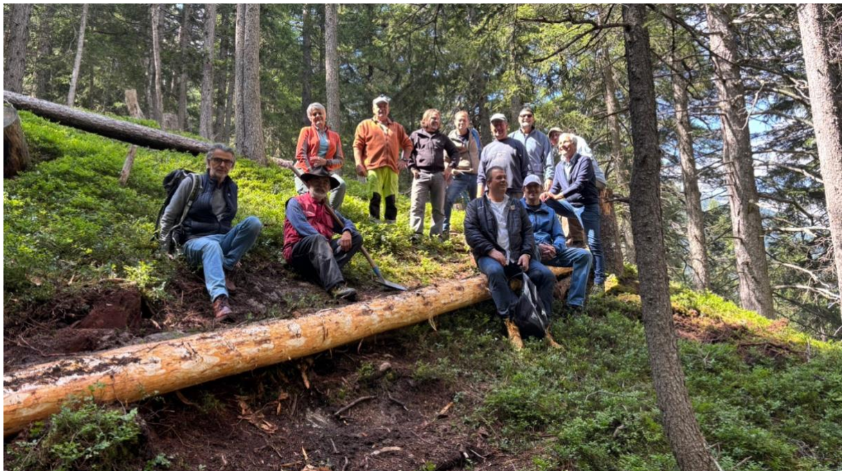
4 Frondiensteinsatz am 22.8.25 bei Innerferrera