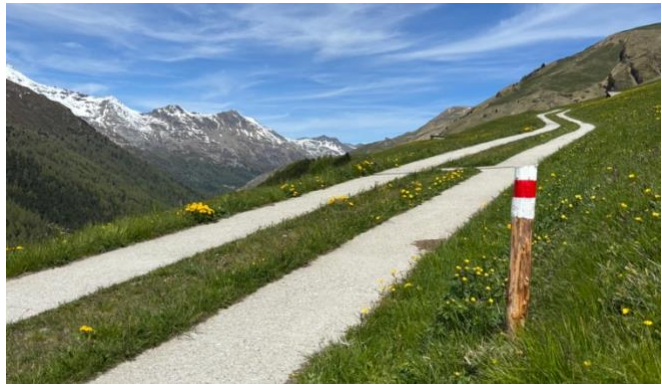
2 Neue Wegführung oberhalb Pürd

Wie alle Jahre hat der Vorstand zusammen mit den Wegmeistern und einzelnen Vereinsmitgliedern im Frühling einige Instandstellungsarbeiten vorgenommen. Im Jahr 2025 wurde